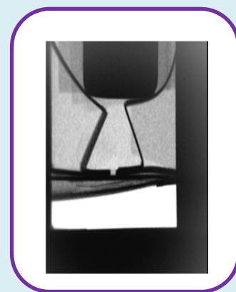
AL/AL ブリスター内の錠剤 カートン内の緩衝材/添文

搬送される包装品にX線をパルス照射し、包装品内容物の有無や割れ・欠け及び異物混入を検査・判定します