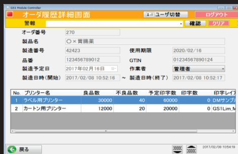
オーダー履歴詳細画面