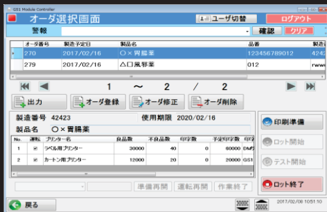
オーダー選択画面