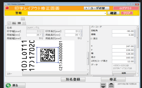
印字レイアウト画面